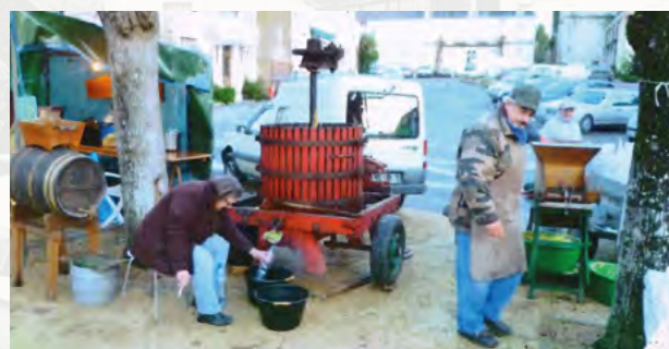
Le marché de Noël existe depuis 2005

Il y eut au maximum 14 foires: une chaque mois et une deuxième en Mai et en Octobre. Après leur disparition, deux foires ont été relancées en 1980 : la foire des oisons du 2 Mai et celle des chrysanthèmes avec une brocante le dernier dimanche d'Octobre.