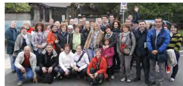
Monticello - 20 ans de jumelage 18-19 mai 2013

Suite à cette réception, l'association Jumelage Martizay-Monticello a étudié la possibilité d'organiser un séjour à Monticello du 12 au 16 juin 2025 afin de répondre à la gracieuse invitation de nos homologues transalpins.