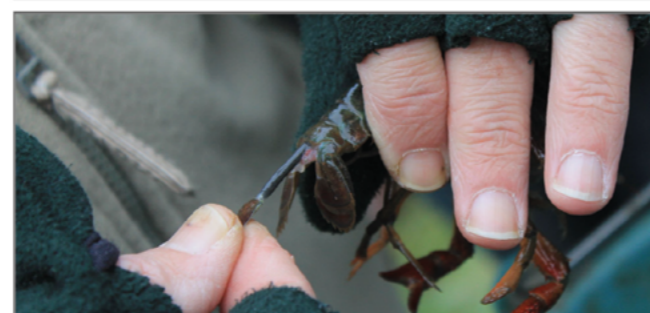
Vous pouvez la châtrer afin de la tuer rapidement, pour limiter la souffrance de l'animal. Ensuite, seulement, vous la transportez.

à disposition du matériel de piégeage* ; il peut également réaliser des diagnostics de présence/niveau d'infestation de l'ERL (financements Etat/Fonds vert). Le contrôle des populations fonctionne lorsque l'action est réalisée de façon concertée, de façon globale sur une même chaîne d'étangs avec une pression de piégeage maintenue toute l'année. Malheureusement, encore un grand nombre d'étangs touchés par la présence de cette espèce ne sont pas contrôlés et représentent des foyers d'infestation non négligeables.