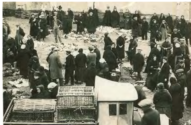
Une ancienne foire aux oisons

Il y eut au maximum 14 foires: une chaque mois et une deuxième en Mai et en Octobre. Après leur disparition, deux foires ont été relancées en 1980 : la foire des oisons du 2 Mai et celle des chrysanthèmes avec une brocante le dernier dimanche d'Octobre.