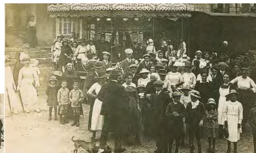
Assemblée : manège 1920

Autrefois, des fêtes que l'on nommait des "Assemblées" avaient lieu dans le bourg ou sur le champ de foire en Mai, le 14 Juillet, en Août et en Décembre, avec des manèges, des tirs à la carabine, des marchands de glaces et de confiseries et un bal qui avait lieu dans une structure en bois que l'on mettait en place à cette occasion. Ces fêtes se déroulaient également dans les hameaux mais, sans manège, comme par exemple, l'assemblée de la Mardelle, le premier dimanche de Septembre.