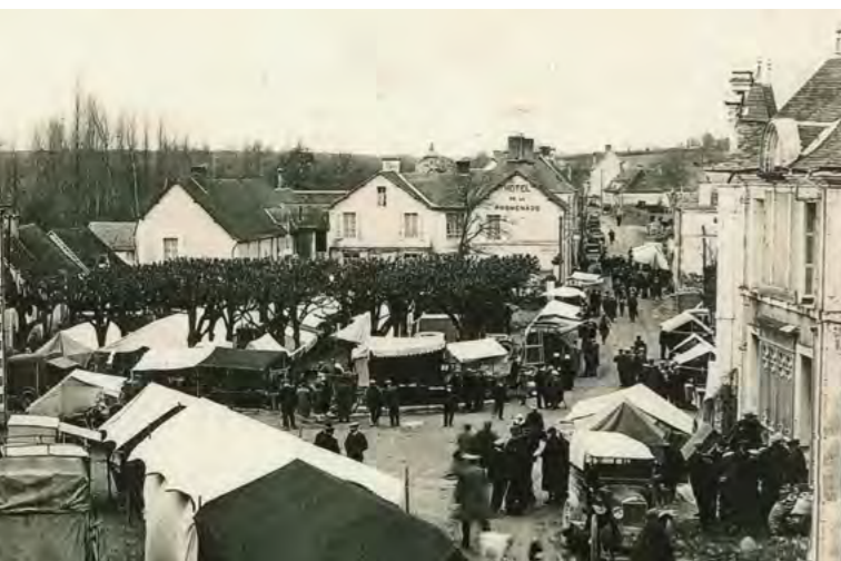
Une foire en 1928

C'est également, dans ces années-là, que sera installée "une bascule d'une force de 6 à 8 tonnes avec capot en tôle sous le coin Sud-Est du champ de foire."